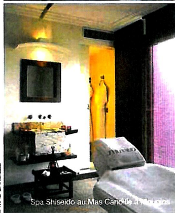
Spa Shiseido au Mas Candille à Mougins