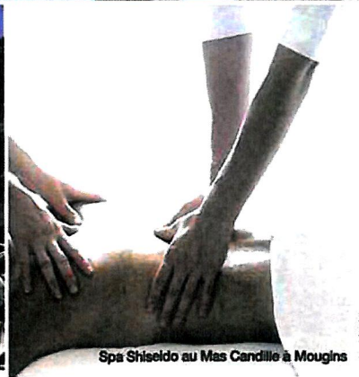
Spa Shiseido au Mas Candille à Mougins