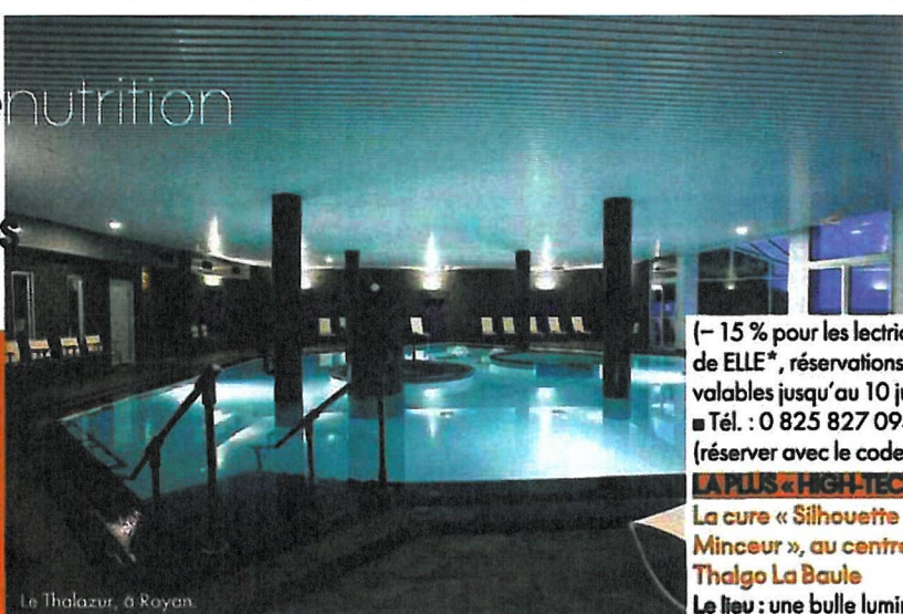
Le Thalazur, à Royan.

Lyashi Dôme à recevoir un long massage reminéralisant, alterne soit avec un drainage, soit avec une réflexologie. Tout ça entrecoupé de pauses jus d'herbe, tisane ou cuillère d'Alcavi (aux 100 plantes germées deshydratées) et couronné par un déjeuner « alimentation du vivant » composé uniquement d'ingrédients non cuits, non sucrés, sans laitages, bref d'aliments complets ou germés. Car l'objectif ici est de vous faire éliminer acides et toxines pour prendre un bon départ dans la saison. Chic et convaincant. Il faut juste assumer la detox du porte-monnaie ! ■ 217, rue Saint-Honoré Paris-1 er Tél. : 01 42 96 00 96. Tarif : 1 045 € les 3 jours, 450 € la journée.